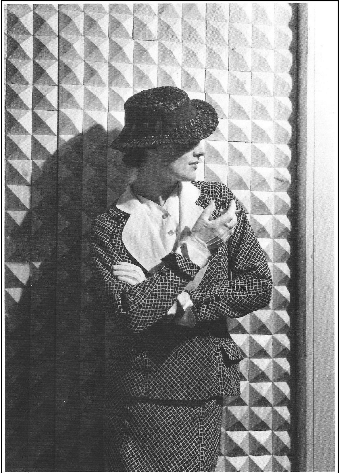
Bilaga 1: En av de första Chaneldräkterna från Channels vår/sommar kollektion 1935.