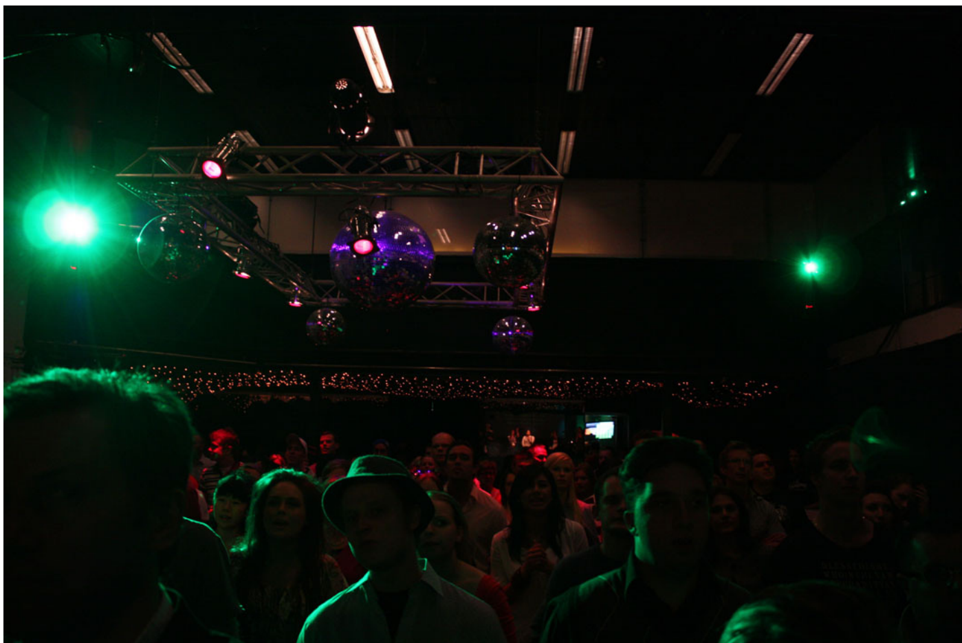
Lördagkväll på Göta källare? Nej, det är söndag och gudstjänst.

hur en tjej i DN:s artikelserie om abort väckte starka känslor. Hon såg abort som ett självklart alternativ, ett preventivmedel.