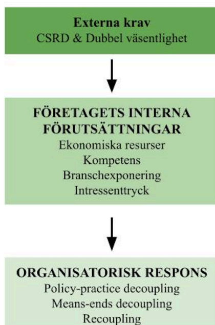
Figur 2. Illustration av analysmodell

Legitimitetsteorin används i denna studie som en analytisk lins för att förstå hur företagen uppfattar de ökade kraven på ansvarstagande och transparens, samt i vilken utsträckning upplevda legitimitetskrav påverkar deras organisatoriska respons. Genom denna lins analyseras ifall implementeringen av dubbel väsentlighet främst kan förstås som ett svar på legitimitetsstryck eller som ett uttryck för mer substantiell förändring inom organisationen.