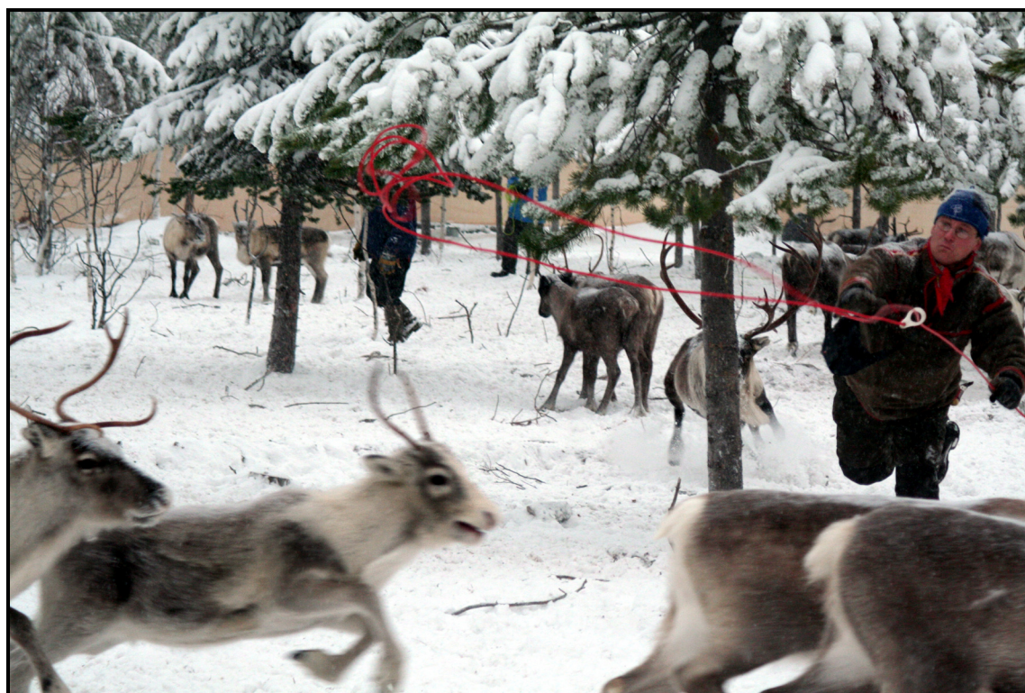
Renskötarna arbetar snabbt och skickligt.

Kalven får i stället ett märke fastsatt i örat och släpps sedan iväg igen.