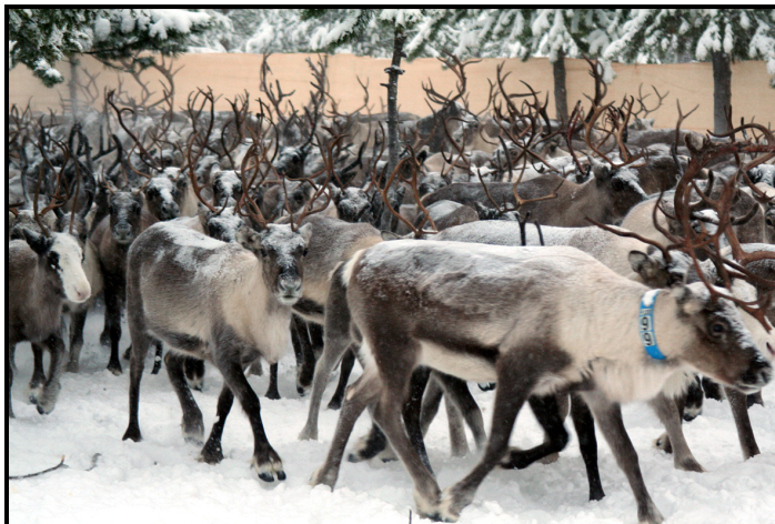
Renens hårstrån är ihåliga för att effektivt isolera mot kylan.

Renarna springer runt, runt i en ringdans. De är ganska små, när mig ungefär till höften. I hjorden ingår halvstora kalvar som efterhängset följer sina mammor, ståtliga tjurar och gammelrenar som lite moloket lufsar på. Pälsen ser len ut. Vissa är gråbruna med inslag av vita partier, andra är mörkbruna, någon är helvit.