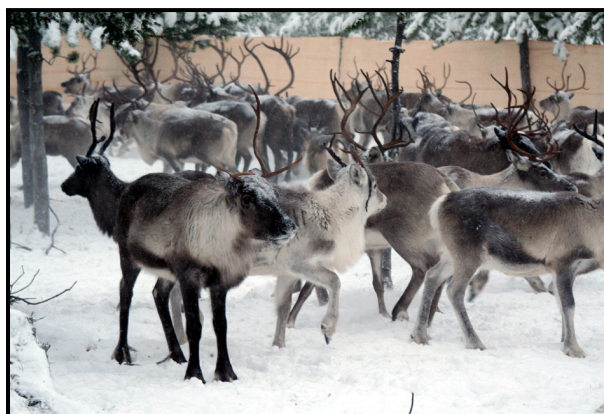
Renarna nöutfodras med pellets.

På Sametinget gör de allt de kan för att skynda på regeringen och få besked om extra medel till katastrofskadeskydd. Jordbruksministern ska i februari besöka renägarna för att själv få uppleva deras situation. ■