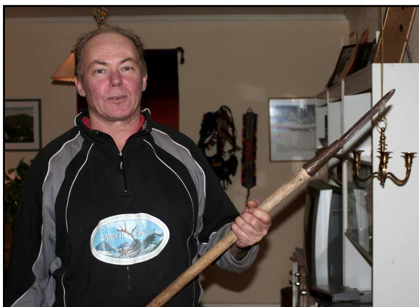
Jakt och fiske är vanliga binärningar för renskötare.

– Björnspjutet är ju några meter långt och ganska grovt, de stack ner spjutet mot marken, väntade och höll det nere, och sen när björnen var skadeskjuten och kom emot dem så reste de spjutet så den själv sprang in i... joouuu, det var ingen lek.