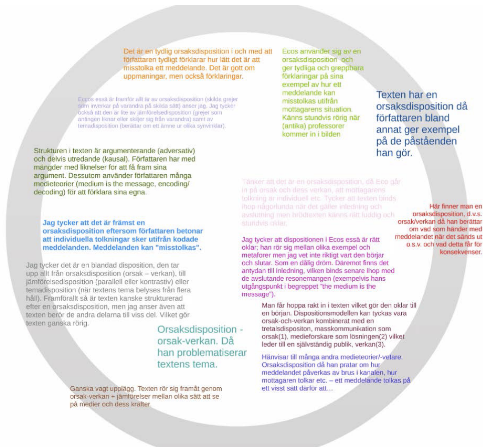
Fig 3. Cirkeln om disposition i Umberto Ecos essä För ett semiologiskt gerillakrig

feedback under förberedelsefasen till seminariet. Kollaborativa medier ersätter inte heller en uppmärksam och lyhörd seminarieledare, och möjligheten att kunna bjuda in tysta studenter till diskussionen genom att hänvisa till deras projicerade seminarieanteckningar utnyttjas bäst om man känner studenterna sedan tidigare.