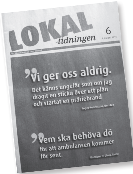
Lokaltidningen 8/2 2012

I tidningen veckan därpå dominerar ockupationen starkt. Citat från två ockupanter upptar hela omslaget (det har en speciell utformning, en vikt tabloid), det blir rubrik i topp på ettan och nästan tre sidor med stora bilder inne i tidningen. Ockupanternas aktiviteter, goda organisation och stödet från lokalsamhället redovisas. Ockupanterna skriver historia, ett utbrutet citat i brödtexten: Dorotea blir aldrig det samma efter det här. En manifestation i Åsele för ambulansen får stort utrymme, utbrutet citat: Vem ska behöva dö för att ambulansen kommer för sent?