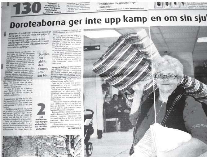
Lokaltidningen 8/2 2012

I tidningen veckan därpå dominerar ockupationen starkt. Citat från två ockupanter upptar hela omslaget (det har en speciell utformning, en vikt tabloid), det blir rubrik i topp på ettan och nästan tre sidor med stora bilder inne i tidningen. Ockupanternas aktiviteter, goda organisation och stödet från lokalsamhället redovisas. Ockupanterna skriver historia, ett utbrutet citat i brödtexten: Dorotea blir aldrig det samma efter det här. En manifestation i Åsele för ambulansen får stort utrymme, utbrutet citat: Vem ska behöva dö för att ambulansen kommer för sent?