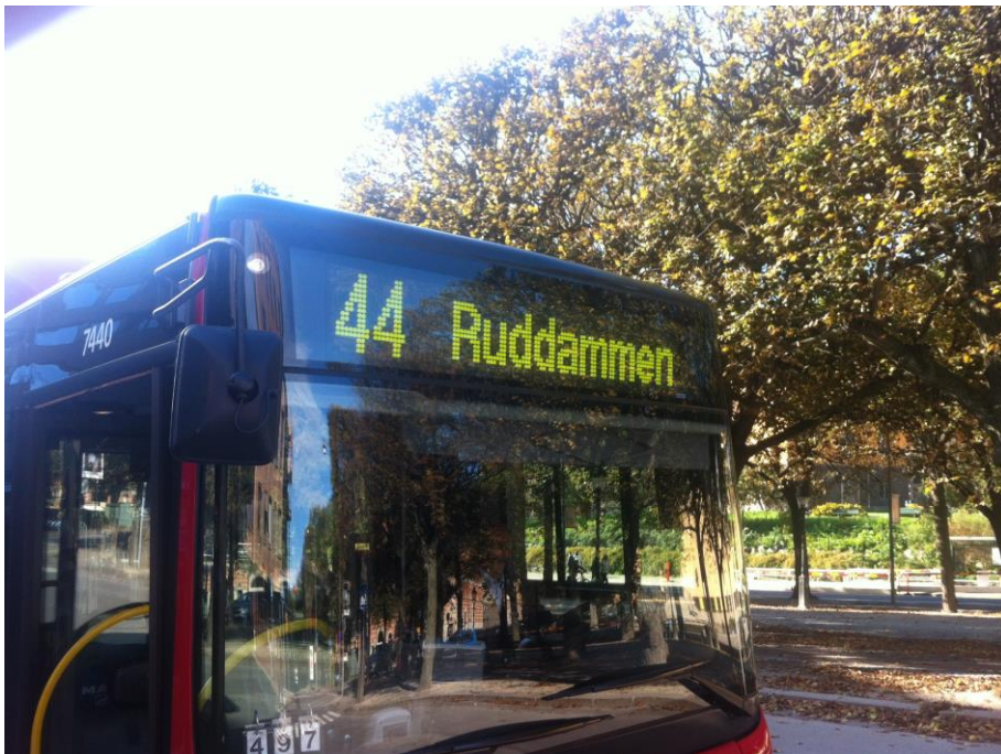
Buss 44 till Ruddammen i Stockholm