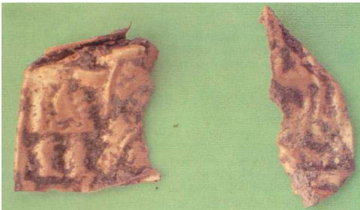
Fig. 4. Guldfoliefiguren från Husby, Glanshammar Sn. (Ekman 1998, s. 63).

Husby, Glanshammar Sn, Sverige: En bruten guldfoliefigur påträffades inom ett område med tjocka kulturlager.