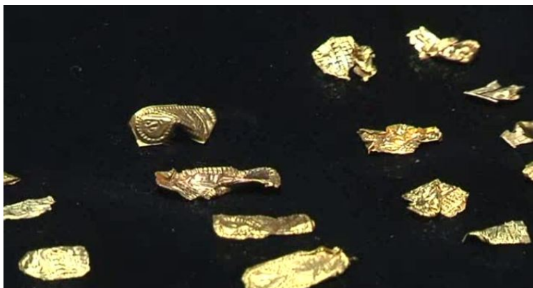
Fig. 7. Bild på guldfoliefigurerna funna i Västra Vång, Ronneby.