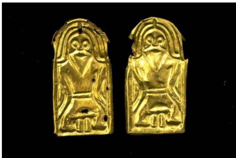
Fig. 2. Guldfoliefigurer funna i Bolmsö, Håringe, Småland.