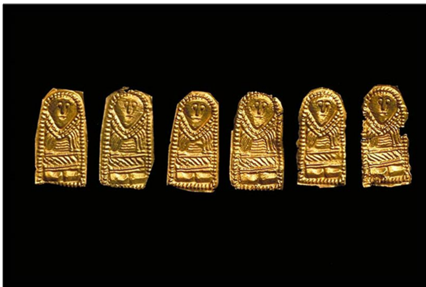
Fig. 1. Bild på några av de guldfoliefigurerna funna på Öland, Eketorps borg (Foto: Gunnel Jansson, 1995).

Det är välkänt att guldfoliefigurerna föreställer olika motiv. Analysen av de ungefär 3500 guldfoliefigurer som man känner till idag har lett till att vi kan identifiera 650 olika stämplat. Bland alla dessa uppklippta samt ristade figurer har man i sin tur identifierat ca 85 olika motiv. De vanligaste motiven är manliga enkla figurer. Djurfigurer har bara förekommit i Bornholm (Watt 2008, s. 45–46, Dos Santos 2010, s. 9).