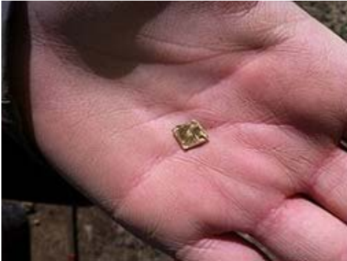
Fig. 5. Vikt guldfoliefigur påträffad i Västra Vång.