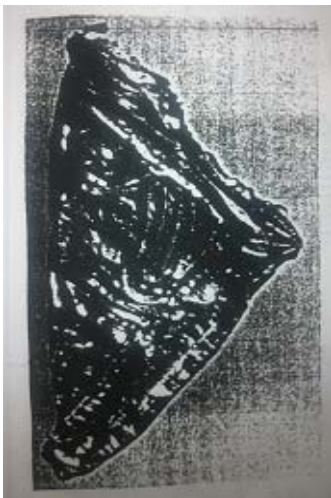
Fig. 6. Guldfoliefigur vikt diagonalt påträffad i Gården Hov (Andreasson 1995, s. 27).

Gården Hov, Norge: Under en sten som låg nere i en grop påträffades en och en halvguldfoliefigur. Hela guldfoliefiguren var vikt diagonalt med framsidan inåt (Andreasson 1995, s. 27).