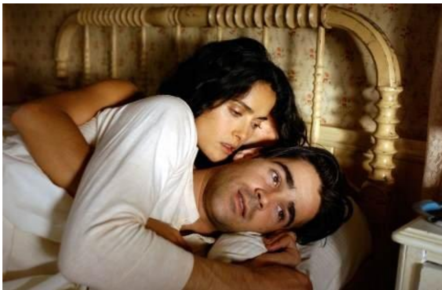
Rollfigurerna i "Ask the dust": Camila och Arturo.