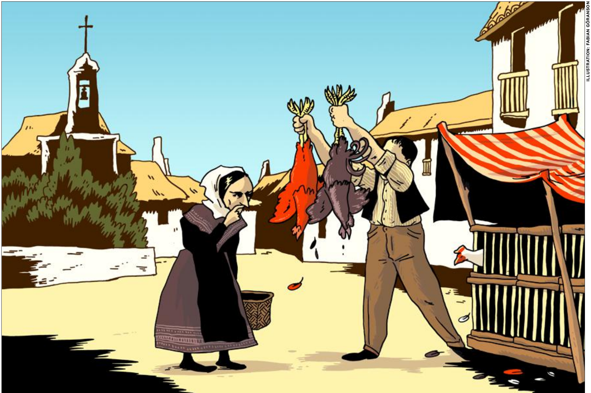
ILLUSTRATION: FABIAN GÖRANSON

Avrättningar och övergrepp utfördes av båda sidor under det spanska inbördeskriget 1936–39. Ny forskning visar på allvarliga blott från regeringssidan som tidigare inte publicerats. En nymornad höger sprider också gärna en bild av kuppmaakarna som förminskar skulden och distanserar arvtagarna från den, skriver Per Lindblom.