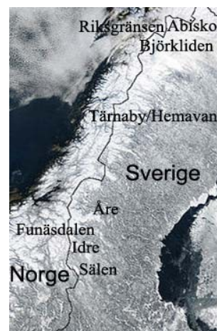
Figur 1: Svenska fjällen

Sveriges största och populäraste skidanläggningar finns i Jämtland och Dalarna och står för drygt 78 procent av landets totala skidturismomsättning. 18 Förutom dessa två populära vinterregioner är även Västerbotten en av de populäraste vinterdestinationerna.