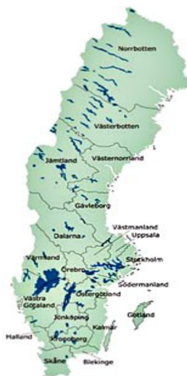
Figur 2: Sveriges län

Att åka bil från Stockholm till Tärnaby tar cirka 10 timmar och med flyg från Stockholm, Arlanda knappt 3 timmar. 30