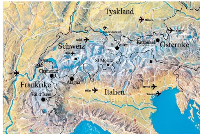
Figur 3: Vinterdestinationer i Alperna

Det tar cirka två timmar med flyg från Stockholm, Arlanda till Salzburg i Österrike och ungefär en timme med busstransfer till vinterdestinationerna. 33 Restiden är liknande även till övriga vinterdestinationer i Alperna.