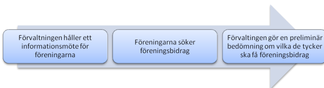
Figur 2. Ansökningsprocessen stadsdelen Spånga-Tensta

I Danderyds kommun skiljer sig ansökningsprocessen från Spånga-Tensta. Där lämnar föreningarna in närvarokort och verksamhetsberättelser som tjänstemännen på förvaltningen sedan granskar. Om det finns nya föreningar som söker föreningsbidrag granskas även de av förvaltningen. Tjänstemännen presenterar de närvarokorten och ansökningar som har kommit