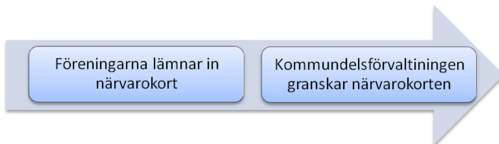
Figur 3. Ansökningsprocessen Danderyds kommun

in för nämnden och ”nämnden bara godkänner budgeten och summorna” (Tjänsteman i Danderyd).