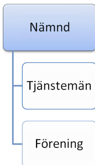
Figur 4. Beslutfattarprocessen

I båda områdena är beslutfattarprocessen relativt lika gällande föreningsliv. Tjänstemännen presenterar ett förslag på bidragsberättigade föreningar som nämnden sedan får godkänna eller avslå.