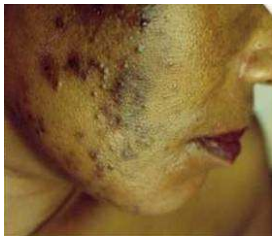
Bild 6. Några av de hudskador man kan få av hudblekningskrämer innehållande Hydrokinon