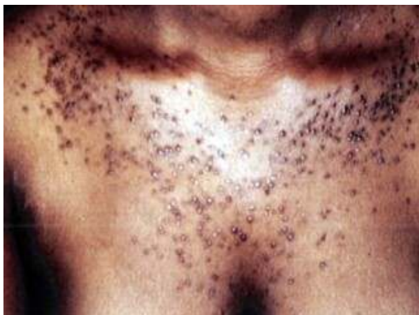
Bild 5. Några av de hudskador man kan få av hudblekningskrämer innehållande Hydrokinon