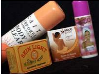
Bild 4. Hudblekningskrämer ”BBC” (2009-12-28)

Hydrokinon används som det främsta ämnet i de hudblekningskrämer som finns, men Hydrokinon, även känt som bensen-1,4-diol används huvudsakligen som framkallningskemikalie vid svartvit fotografering. (Kemikalieinspektionen, 2009)