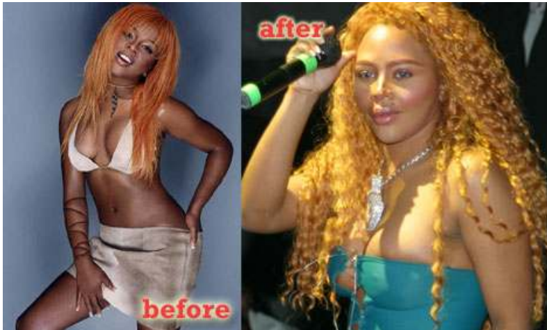
Bild 2. Lil' kim – amerikansk artist vars fans spekulerar om huruvida hon bleker sin hy eller inte