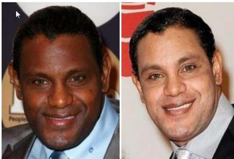
Bild 3. Spelare i den nordamerikanska basebolligan Major league baseball och som offentligt erkänt att han bleker sin hy.

men eftersom jag anser att kvinnor är en mer utsatt grupp så har jag valt att enbart använda kvinnor i studien. För att kunna anlägga en adekvat analys har jag valt att skapa ett eklektiskt paradigm bestående av ett medievetenskapligt, sociologiskt och psykoanalytiskt teoretiskt ramverk som är välavvägt för att kunna fungera som ett verktyg i min analys av mina informanters utsagor. Detta då en enskild teori inte täcker in alla områden jag avser