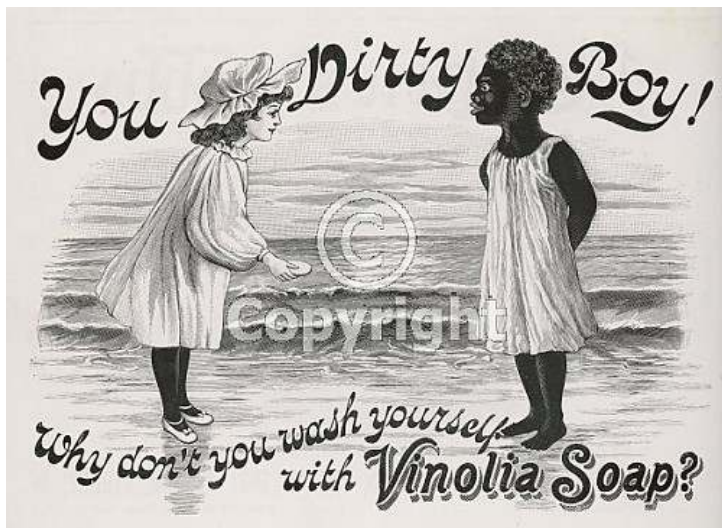
Bild 7. Viktoriansk reklamansons visandes reklam för tvål i slutet på 1800-talet.

"dirty-boy-vinola-soap-ad", (2010-01-02)