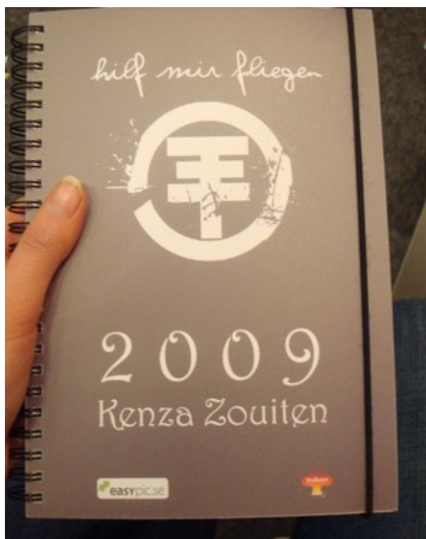
Såhär snygg är min almanacka från vulkan.se

Tävlingen avslutas imorgonkväll klockan 20.00. Lycka till!