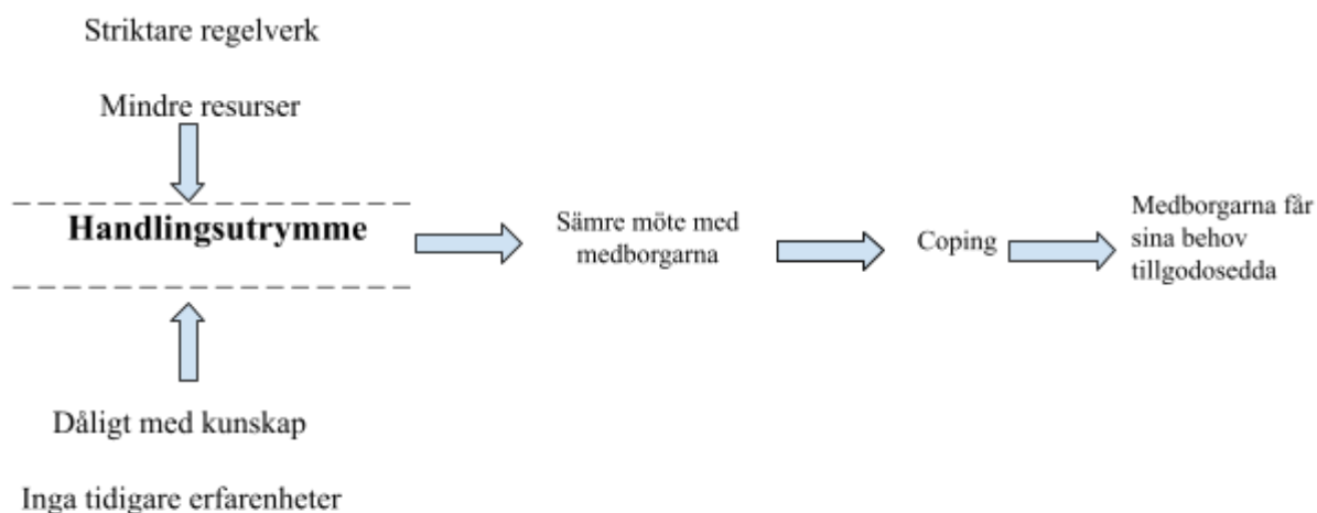
Figur 3. Illustration av vad som händer med närbyråkraters handlingsutrymme i kris om ett striktare regelverk implementeras och resurserna minskar i kombination med dålig med kunskap och inga tidigare erfarenheter.

Striktare regelverk vid kris begränsar handlingsutrymmet, liksom mindre resurser begränsar handlingsutrymmet. Dåligt med kunskap och inga tidigare erfarenheter begränsar handlingsutrymmet och leder till sämre mötet med medborgarna än vad regelverket syftar till. Närbyråkrater använder copingstrategier för att hantera slitningen mellan den politiska idealbilden och verkligheten för att tillgodose medborgarnas behov.