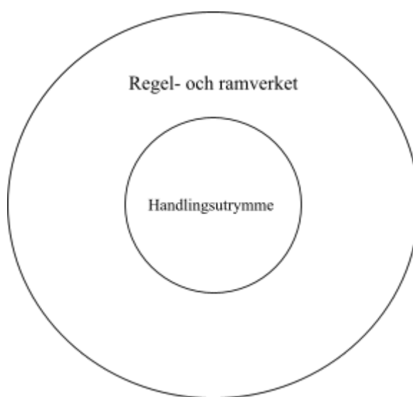
Figur 1. Illustration skapad utifrån Dworkins (1978) beskrivning vad vad som begränsar och formar handlingsutrymmet.

Discretion, like the hole in a doughnut, does not exist except as an area left open by a surrounding belt of restriction. It is therefore a relative concept. It always makes sense to ask, "Discretion under which standards?" or "Discretion as to which authority?" (Dworkin, 1978, s.31-32)