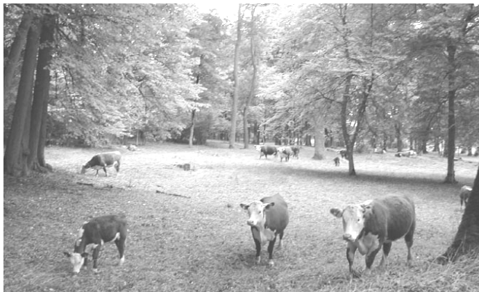
"Kräka på skogen". Kulturmiljövård. Svartsjö kungsgård, Stockholms län 2000.

Så alla naturutsikter är ju faktiskt kulturutsikter... För så fort det kommer till ett mänskligt öga som tittar, så tänker man ju någonting. Och när man tänker blir det en beskrivning, ett ord. Och så blir det kultur, det går inte att komma ifrån.