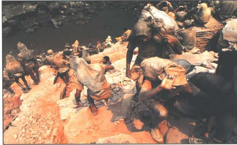
Bild 9.2. Arbete i ett brasilianskt dagbrott.