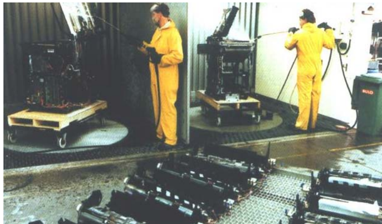
Bild 9.1. Industriarbete i Holland.

Männen i industrilokalen bär gula overaller, har ansiktsskydd och arbetar med att rengöra maskindelar med högtryckstvätt. De är till utseendet västerlänningar och bildtexten talar om att företaget de arbetar för finns i ”Holland”. 81