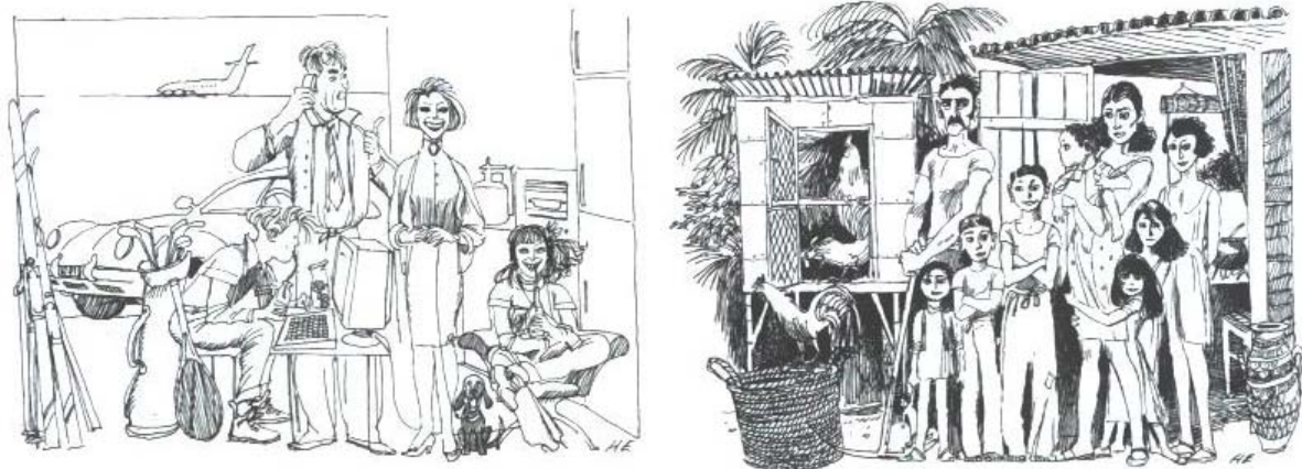
Bild 8.1 En "typisk" i-landsfamilj och en "typisk" u-landsfamilj.

U-landsfamiljen är mörkhårig och består utöver fadern och modern av sju barn. De står framför ett hus med plåttak och plankdörr. Inne i huset ser man en trebent järngryta, avsedd att användas över öppen eld. En tupp och ett par höns syns på bilden och i bakgrunden svävar palmkronor. Kvinnan bär på det minsta barnet och har ett par av dess syskon tryckta mot sig. Fadern står lutad mot en hacka.