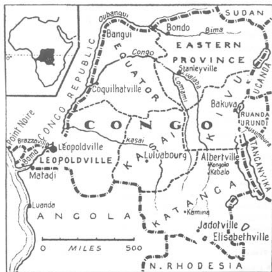
Karta över Kongo, som även visar dess läge i Afrika.