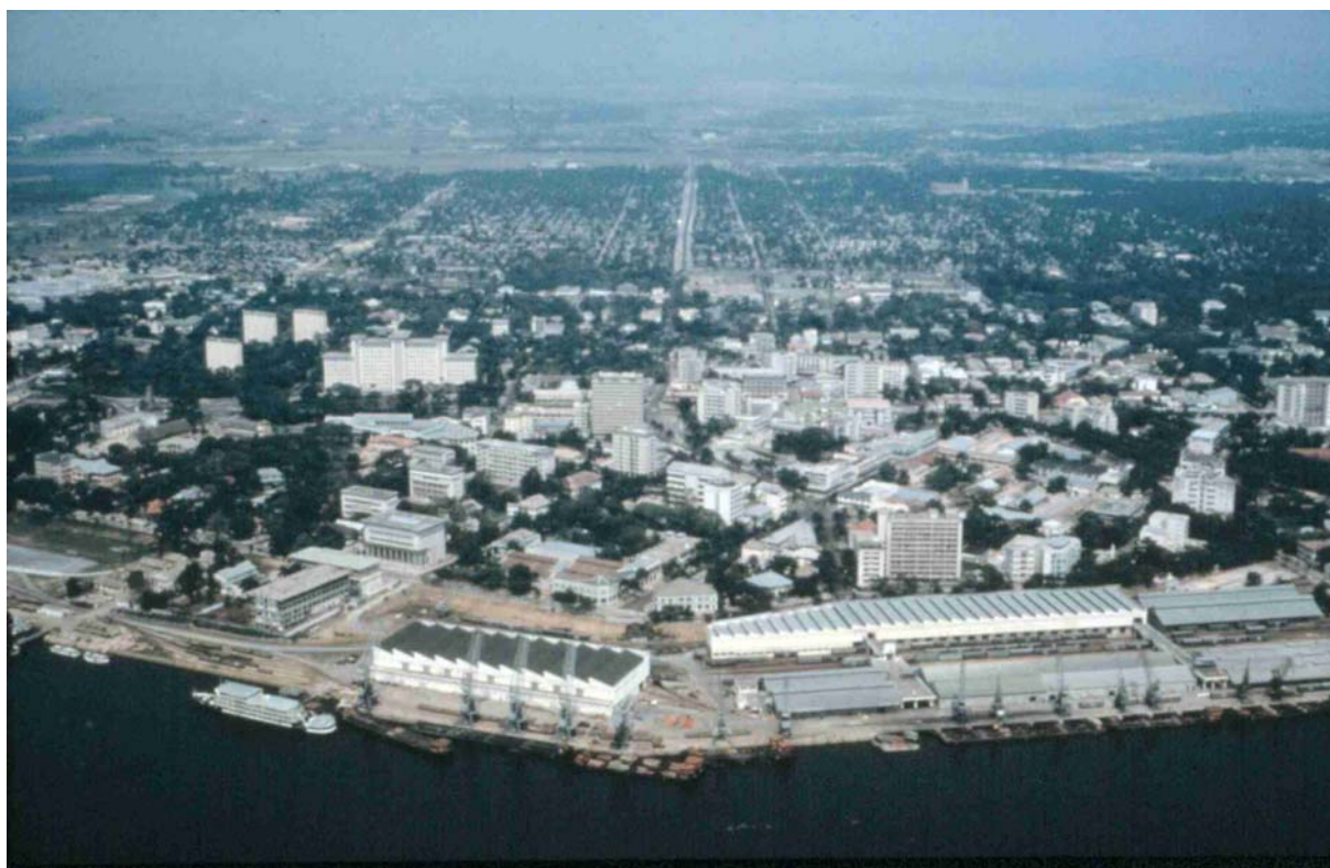
Kongos huvudstad Leopoldville (numera Kinshasa) i början av 1960-talet. Diplomatkvarteren låg i området strax intill hamnen.

B-uppsats Fortsättningskurs Historia vt 2005 Handledare Anders Blomqvist 30 maj 2005