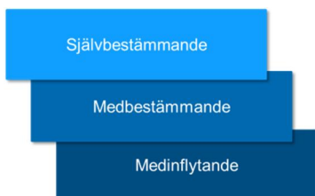
Figur 2 Illustration av elevinflytande nivåer (Jensen, 2011)

När det kommer till inflytande och delaktighet på fritidshemmet är det viktigt att tänka på att begreppen kan se olika ut beroende på hur de används. Elsebeth Jensen (2011) beskriver att det finns olika grader av elevinflytande och delaktighet. Jensen (2011) beskriver att det finns tre stycken nivåer av elevinflytande/elevdeltagande. De beskrivs som medinflytande, medbestämmande och självbestämmande, se figur 2.