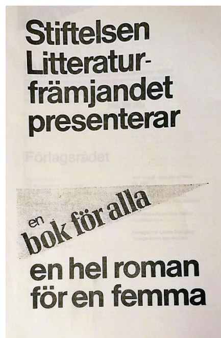
Bild 1: Informationsblad från Stiftelsen Litteraturfrämjandet (1976)

Jag vill i detta avsnitt visa den utveckling som föranledde En bok för alla, hur det kunde komma sig att staten tecknade ett avtal med en stiftelse som jobbade med läsfrämjande om att ge ut kvalitetsböcker till lågpris och finansierade det förlag som den stiftelsen kom att ge ut böckerna igenom – nämligen En bok för alla. Litteraturen som politisk fråga var inte ny 1976. Det var däremot det direkta statliga ingripandet i skapandet av ett så kallat massmarknadsförlag. Jag tar min utgångspunkt i den utredning som tillsattes år 1968 som behandlade frågan om litteraturens roll i samhället och vilka stödåtgärder samhället kunde använda för att se till att litteraturen stärktes. Därefter kommer jag att diskutera det som kommit att kallas för förlagskrisen åren 1970–1971 för att se hur denna påverkade de stora förlagshusen och bokutgivningen och hur krisen lade grunden för de förslag som åren därpå skulle lanseras för hur litteraturen skulle stärkas och räddas undan framtida kriser.