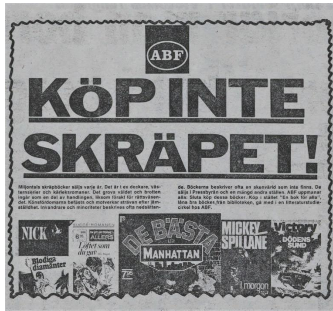
Bild 4: ABF lanserar sin kampanj "Köp inte skräpet!", från Aftonbladet 23 oktober 1978.