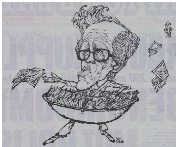
Bild 3: Karikatyr föreställande Bertil Zachrisson av EWK, publicerad i Aftonbladet 23 maj 1976

Under återstoden av våren 1976 är skrivierna om En bok för alla i Aftonbladet , Expressen , Svenska Dagbladet och Dagens Nyheter sparsamma. Den 23 maj skrev dock Aftonbladets ledarsida i en osignerad artikel om folkbokens renässans. Här beskrivs hur bokmarknaden under de sista årtiondena alltmer avskärmats sig från den bredare allmänheten och hur monopoliseringstendenser och centralisering inte har lett till vare sig lägre bokpriser eller kvalitetslitteratur som tillgängliggjorts för den läsande allmänheten. Slutsatsen som dras är att detta beror på att de traditionella förlagen