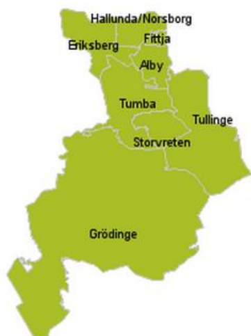
Figur 1 Karta över Botkyrka Kommun med de olika områdes-indelningarna (Botkyrka.se).

Norra och Södra Botkyrka skiljer sig i många avseenden där i stort sett hela Norra Botkyrka är en del av det så kallade miljonprogrammet som idag är ”känd” för att vara utsatta och marginaliserade områden. Norra Botkyrka byggdes under 1970-talet som är en del av det riksomfattande projektet Miljonprogrammet (Johansson 1993:98). Södra Botkyrka till skillnad från Norra Botkyrka är bebyggd med mycket villabebyggelse och anses vara i mångt och mycket den ”rikare” delen av Botkyrka Kommuns två områdesdelar. Längre fram i studien kommer det att redogöras för de socioekonomiska resurser som bidrar till denna uppfattning.