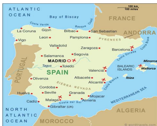
Figur 1. Karta över Spanien

Den spanska ögruppen Balearerna är ett av de mest populära turist resmålen i Spanien och en av de mest besökta sol- och bad destinationerna i Europa. Ön är belägen i Medelhavet utanför nordöstra delen av Spanien och öarna är lätta att nå från de flesta europeiska länderna. Regionen består av tre öar: Mallorca, Menorca och Ibiza, och de två små och orörda öarna Formentera och Cabrera (Garin-Munoz & Montero-Martin, 2007, s. 1224). Mallorca är den största av öarna som tillhör ögruppen Balearerna (Royle, 2009, s.227) som består av 3640 km 2 och har en befolkning på cirka 869.100 invånare (www.ne.se). Trots att turismen är en stor industri i dag, har turismens relation till språket fått för lite uppmärksamhet (Bruyèl-Olmedo & Juan-Garau, 2015, s. 598). De två officiella språken i Mallorca är katalanska och spanska, dock är katalanska det lokala språket som främst talas på ön. Den lokala dialekten av katalanska som talas på ön är mallorkinska, med ett inslag av lite olika varianter i de flesta byar (en.wikipedia.org).