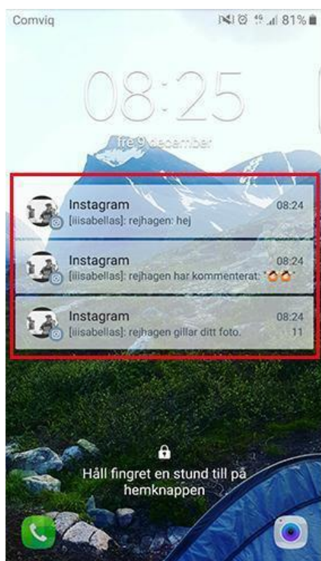
Figur 1. Notifikation på Instagram låsskärm

När användaren går in på inställningar, vidare till push-meddelanden, kan notifikationer för dessa händelser inaktiveras eller bara visas från personer användare följer. Vidare kan användare inaktivera notifikationer på specifika konversationer. Användaren kan även i vissa mobiltelefoner ändra inställningar välja notifikationsinställningar för specifik applikation. Detta innefattar inställningar såsom visning i låsskärm, ljud samt ljus.